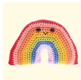
REGENBOGEN - WARME FARBEN