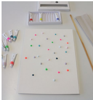
1. Die Acrylfarben in kleinen Punkten über das Blatt verteilt auftragen.

Malunterlage, diverse Papiertücher zum Reinigen, Pinsel zur Korrektur